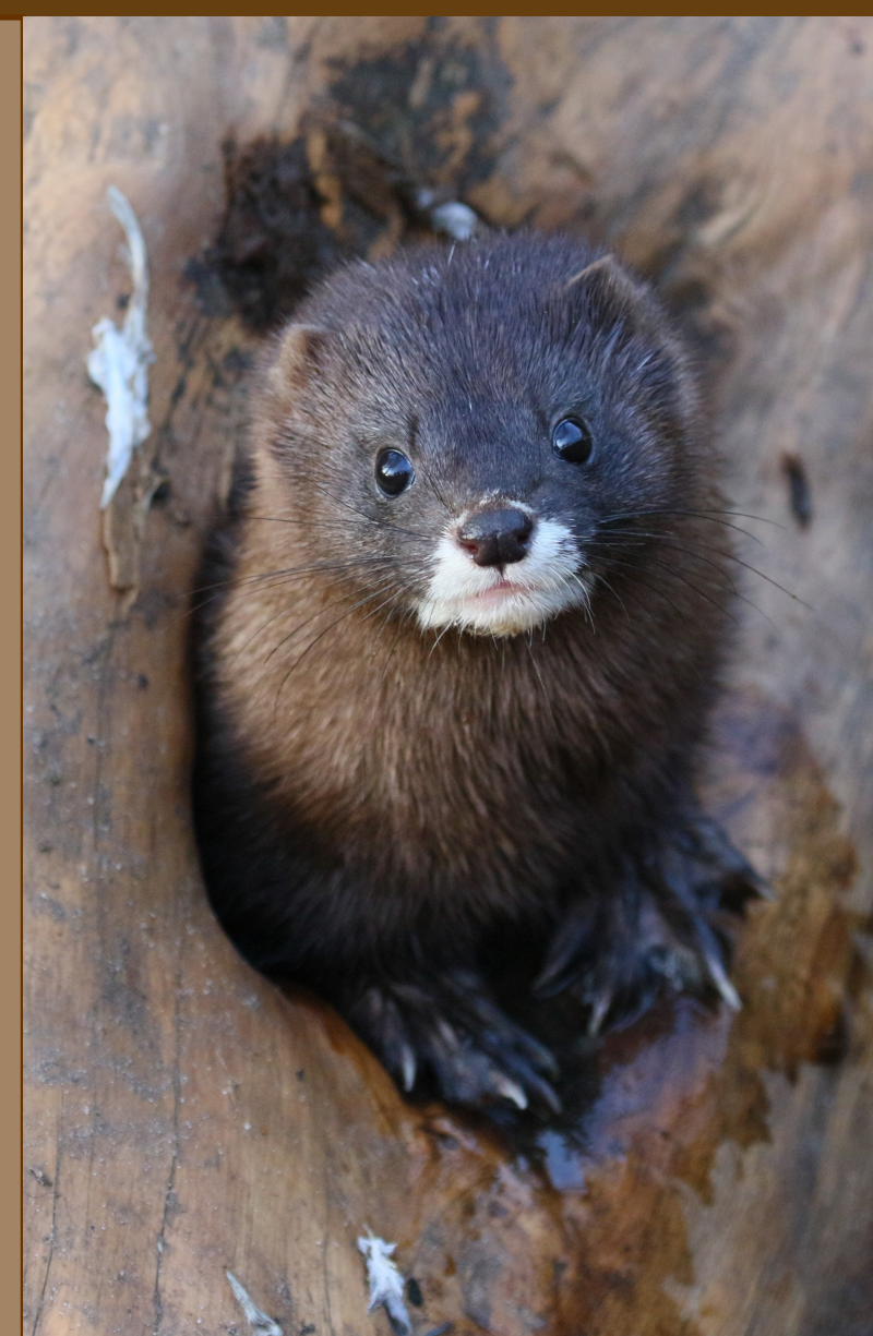
Ordre de carnivores Famille des mustélidés Taille 30à40cm Poids 500g à 1kg Faune française protégée, Annexe2 convention de Berne

Le vison d'Europe est un petit mustélidé, de la même famille que les putois, fouines, belettes et loutres. Comme eux, c'est un mammifère carnivore. Mesurant environ 30 à 40cm pour un poids de 600g à 1kg, il possède un pelage entièrement brun à l'exception d'une tâche blanche sous le museau.